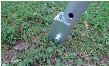
A punta per terreni soffici Spade-shaped end for soft ground