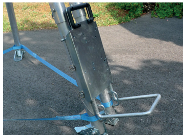
Base di fissaggio per l'argano. Fixation plate easy to set up.