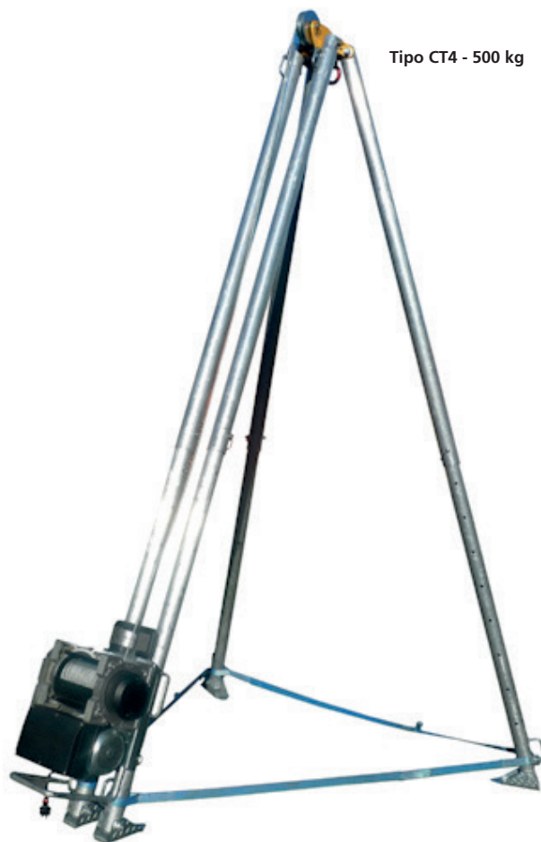
Tipo CT4 - 500 kg