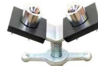
testa a "V" + sfere