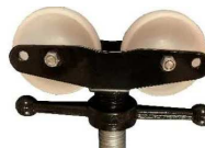
testa con ruote in nylon