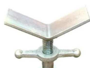
testa a "V" std