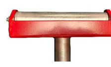
testa con rullo