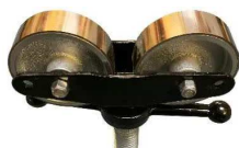
testa con ruote in acc. inox