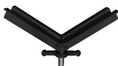
testa a "V" large