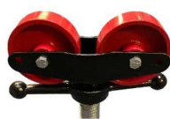
testa con ruote in acciaio