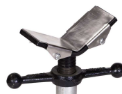
supporto inox per testa a "V" std